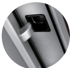
Perno fixo (em gancho)