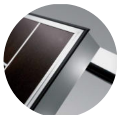
Perfil de remate em alumínio anodizado