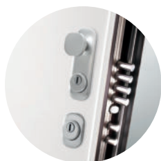
Puxador D-Style (extra cromo satinado)