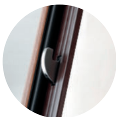
Desviador Hook (na tranca inferior)