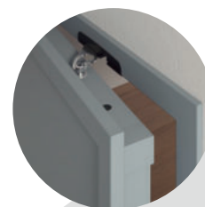
Limitador de abertura Open view