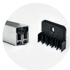
Soleira dupla + kit No-Air