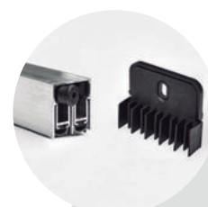
Soleira dupla + kit No-Air