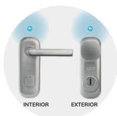
LED indicador de estado da porta