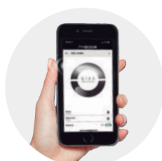
App My Door