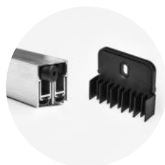
Soleira dupla + kit No-Air