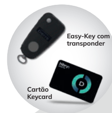
Chaves eletrónicas (Easy-Key + Keycard)