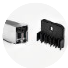
Soleira dupla + kit No-Air