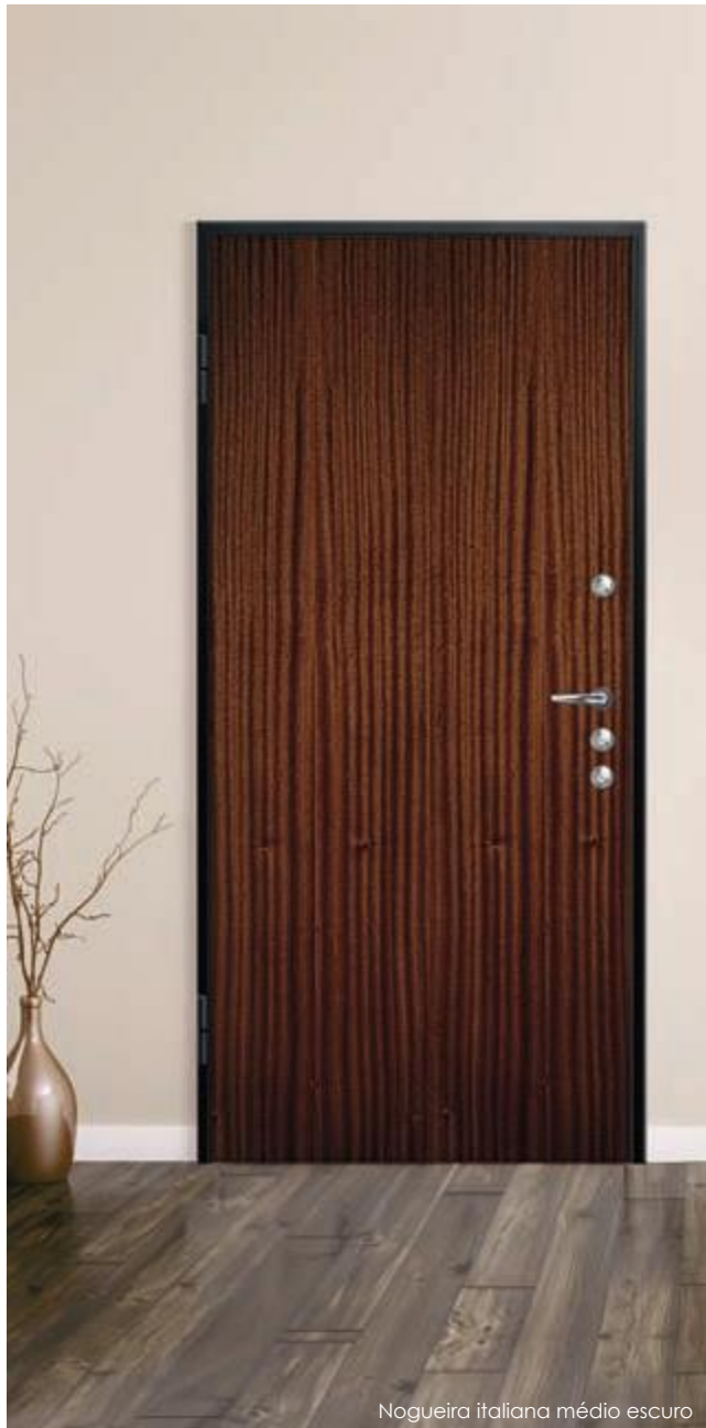
Nogueira italiana médio escuro