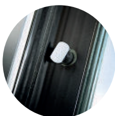
Desviador Artiglio (na tranca inferior)