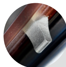
Perno fixo Shild (com reforço anti-perfuração)