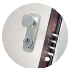
Puxador D-Style (extra cromo satinado)