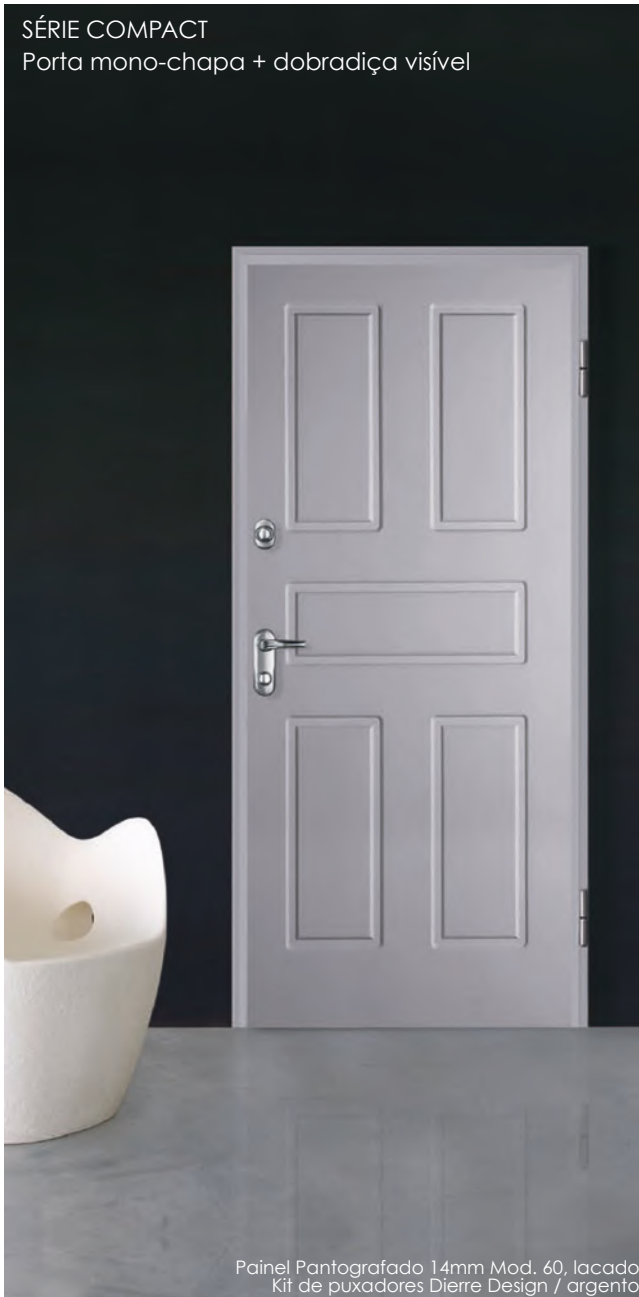
Painel Pantografado 14mm Mod. 60, lacado Kit de puxadores Dierre Design / argento