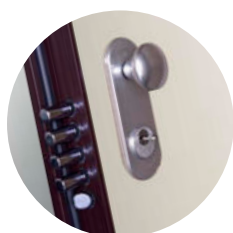
Puxador New Creta (argento)