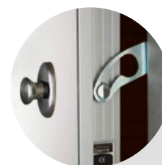
Limitador de abertura (extra argento)